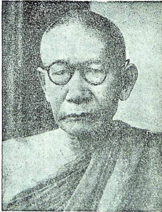
សម្តេចព្រះមហាសុមេធាធិបតីព្រះនាម ជួន ណាត ព្រះសង្ឃរាជ គណៈមហានិកាយ